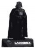
Standee de Lamicorr