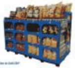
Exhibidor de Lamicorr